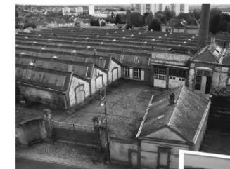
Turpault, Cholet (49)

Période de stagnation. À 14 000 industriels tous confondus